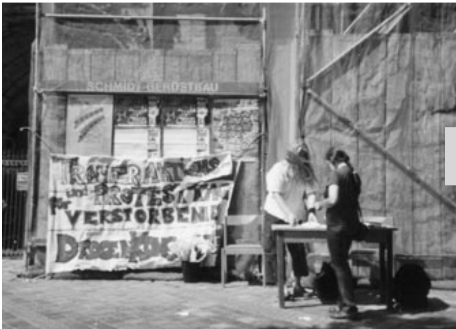
Fotos: Der Junkie Bund Nürnberg in Aktion