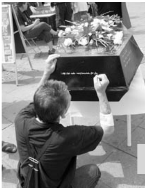
Der Gedenktag in Berlin