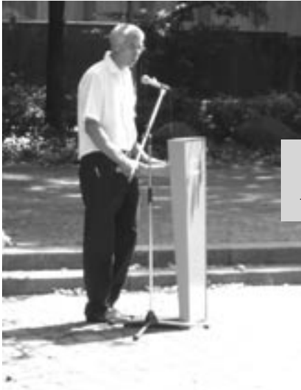
Der Organisator J. Klee