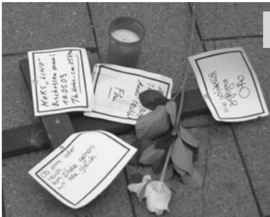
Persönliche Botschaften an einem Holzkreuz