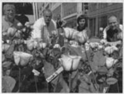
Mit Rosen und Namenszetteln erinnerten Mitarbeiter der Mainzer Suchthilfe an Drogentote, die von ihnen betreut worden sind. Dadurch wurde es sehr persönlich.