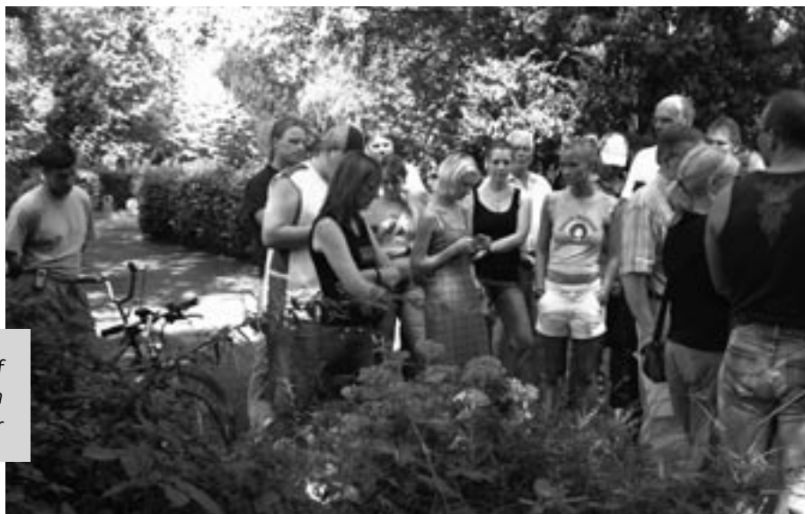
Foto rechts: Gedenkfeier auf dem Südfriedhof Foto unten: Der eindrucksvolle Gedenkstein für verstorbene Drogengebraucher