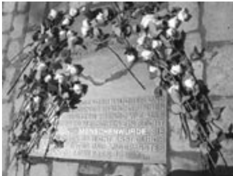
Foto unten: Die Gedenktafel in der Taunusanlage Foto rechts: Der Infostand der Frankfurter Aids Hilfe