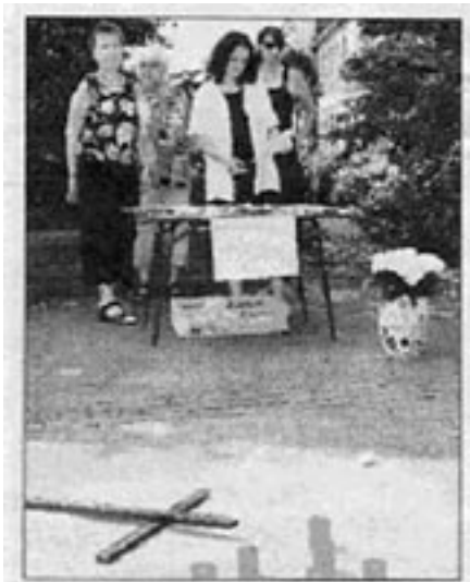
Eltern und DroBeL informieren auf dem Rathausplatz über die Suchtproblematik. Jarolim-Vörmeier