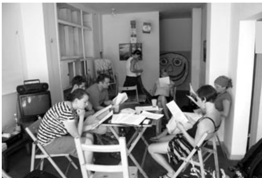
Die Aktion wird vorbereitet...