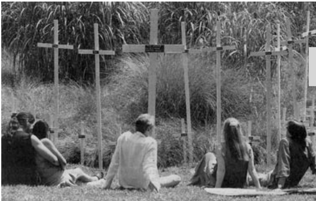
JES stellt neun Kreuze im Stadtgarten auf.