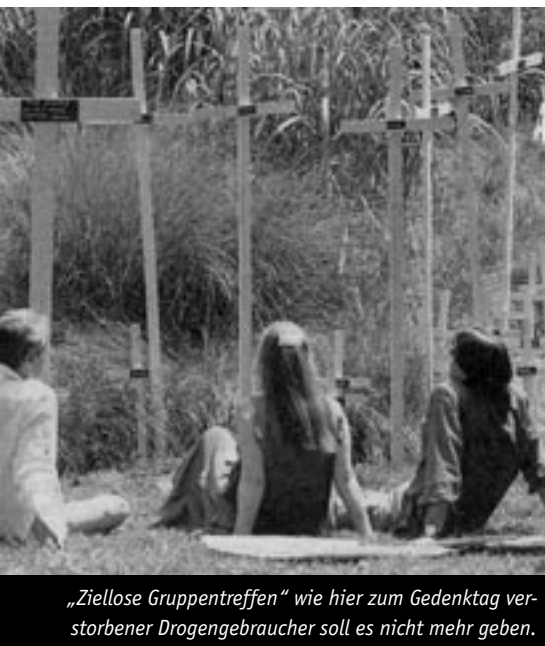
„Ziellose Gruppentreffen“ wie hier zum Gedenktag verstorbener Drogengebraucher soll es nicht mehr geben.

hindern. „Sonst entsteht eine Sogwirkung und es kommen immer mehr.“