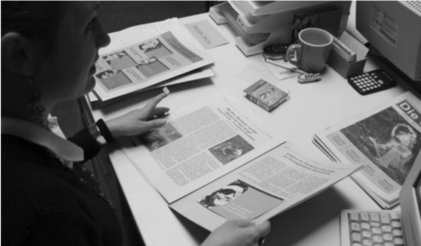
Die ganze Redaktion der Zeitung „Die Straße“ unterstützt die Postkartenaktion der DAH