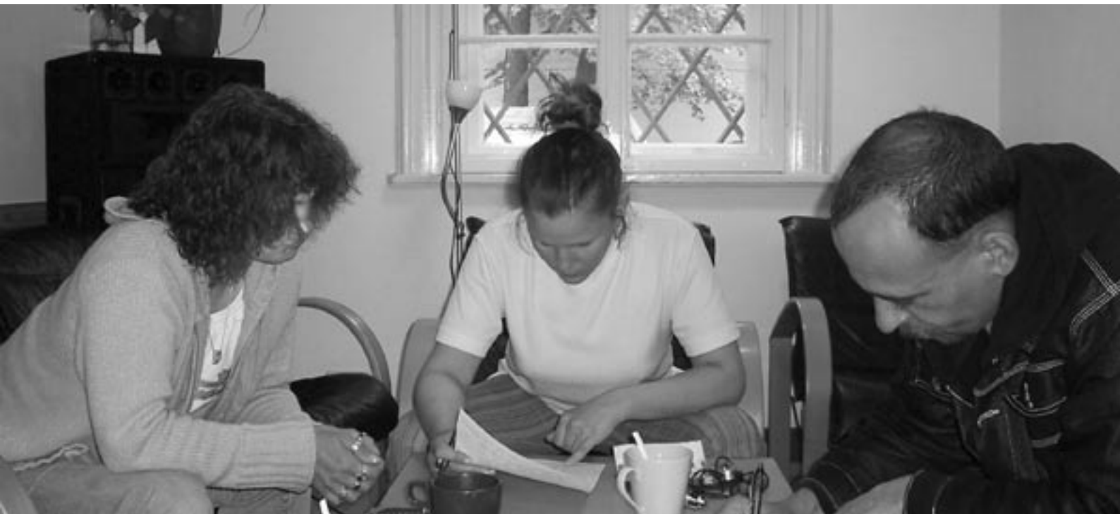
Mitglieder von JES Augsburg beim Gruppentreffen