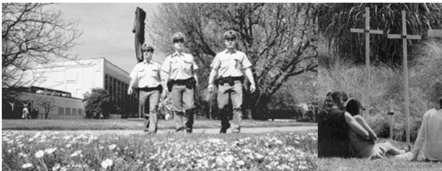
Fotos und Bildbeschreibung: „Die Stimme“, Heilbronn: „Die Drogenszene im Stadtgarten ist zerschlagen, die Polizei kontrolliert“

Mit diesem Bericht geben wir einen Einblick in die Heilbronner Geschehnisse und lassen Drogengebraucher zu Wort kommen. Macht euch selbst ein Bild.