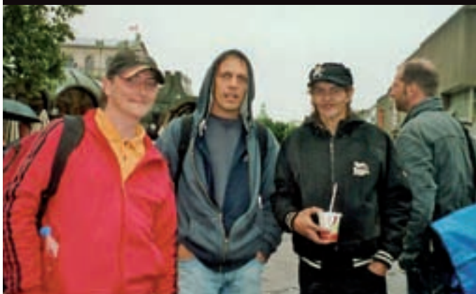
Mitglieder von JES-Hannover und JES-Peine