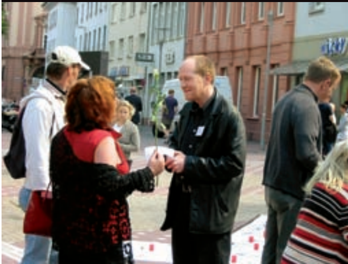
Gespräche mit Bürgern