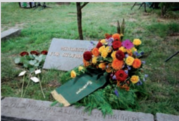
Der Gedenkstein in Kopenhagen