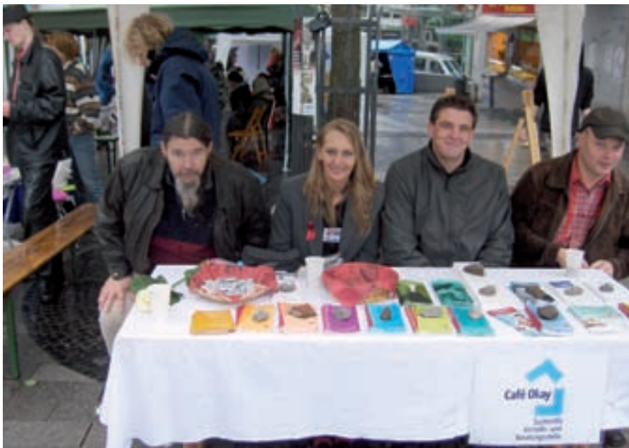
Mitarbeiter von JES-Wuppertal und CAFÉ OKAY