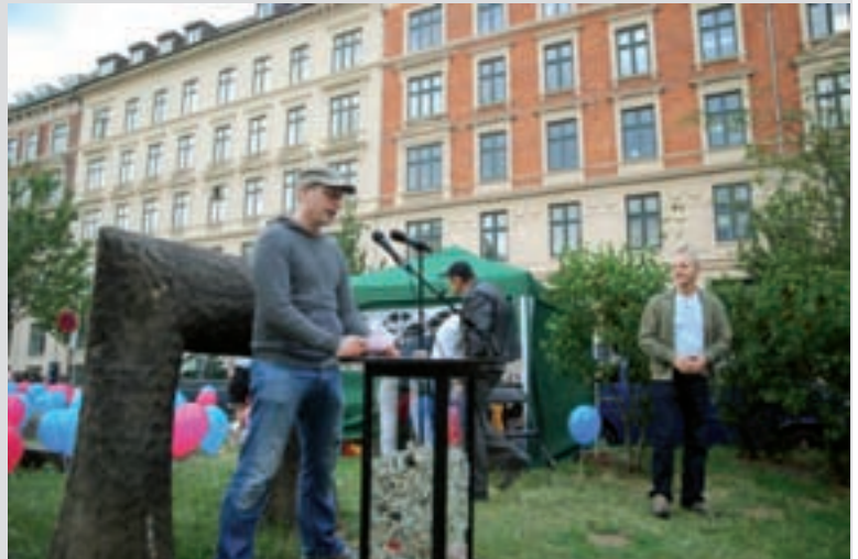
Schwedische User zu Gast in Dänemark