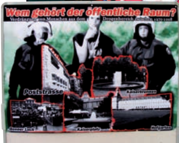
Gegen die Vertreibung von Randgruppen