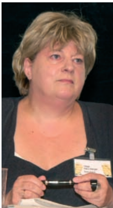
Schirmherrin Helga Kühn-Mengel

Unser Dank geht auch an die Schirmherrin des 10. Gedenktages, der Patientenbeauftragten der Bundesregierung und MdB Frau Kühn-Mengel (SPD), sowie an viele Landes- und Kommunalpolitiker die durch ihre persönliche Teilnahme unsere Veranstaltungen bereicherten.