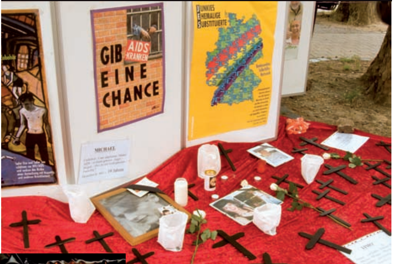
Information und Gedenken – Stand vom Junkiebund Köln