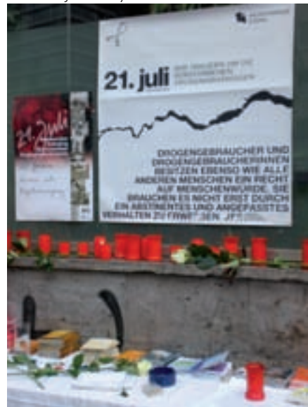
Infotisch und Gedenken vor dem La Strada