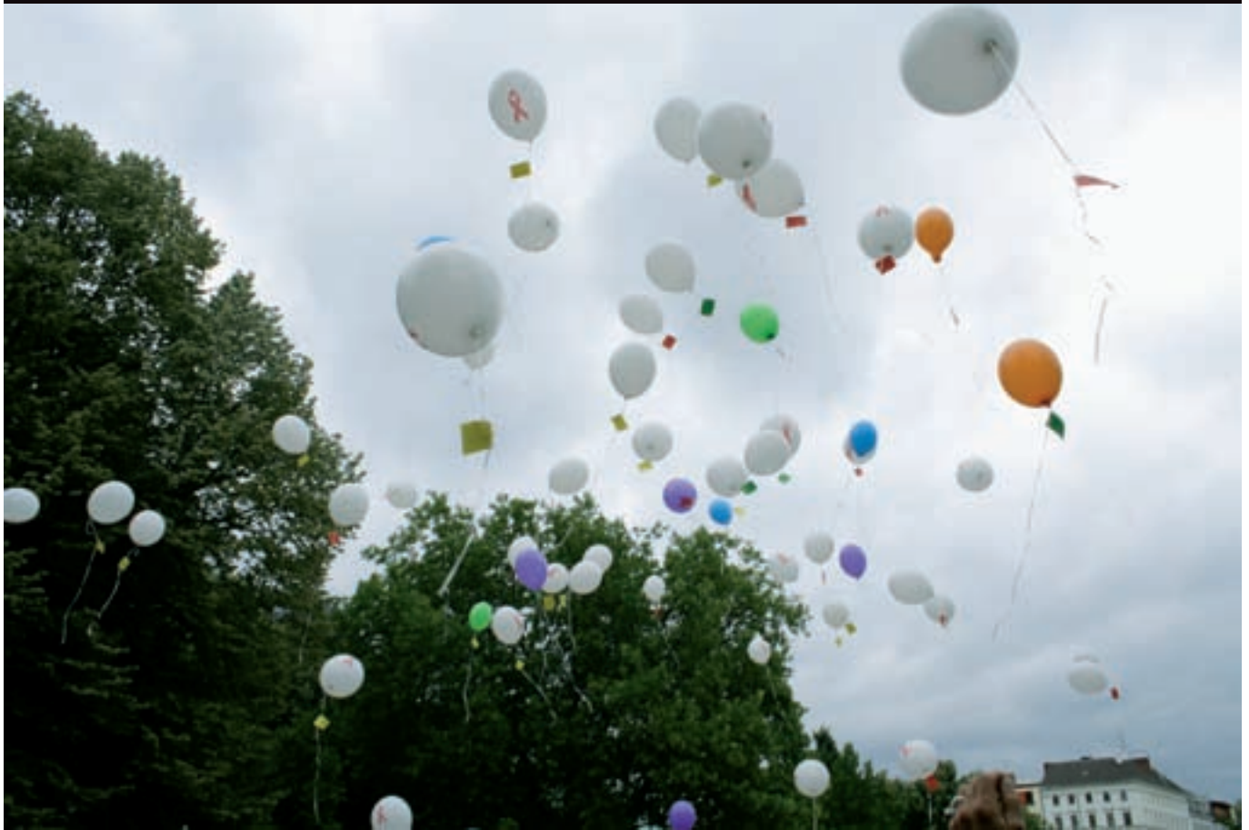
Bunte Ballons gegen das Vergessen