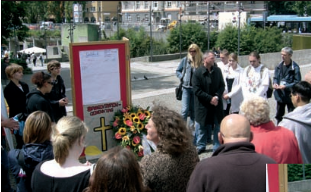
Foto links: Öffentliches Gedenken in München | Foto unten: Th. Niederbühl von der AIDS-Hilfe München