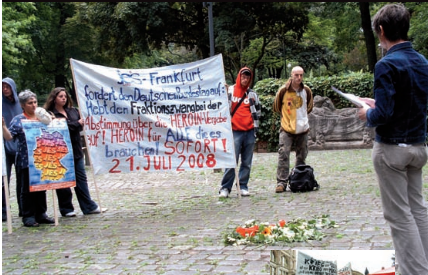
Rede an der Gedenkplatte