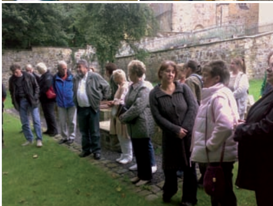
von oben links nach unten rechts: Mahnmal für verstorbene Drogengebraucher in Osnabrück | Quilt von JES-Osnabrück | In Gedenken | viele Gäste auch in Osnabrück