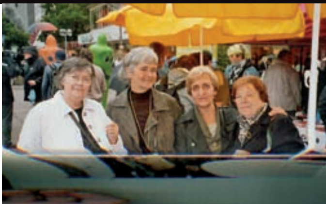
Mitglieder der Elterninitiative