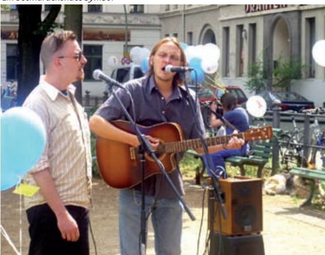
Musikalisches von Mad & Übel

Bündnis gedenkt der verstorbenen Drogenabhängigen und appelliert an die Humanität der Öffentlichkeit