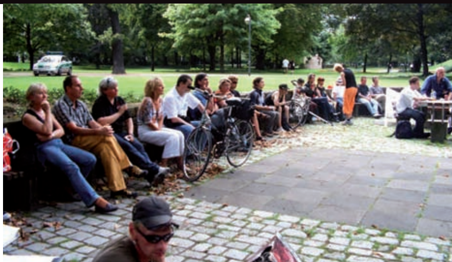
In der Taunusanlage