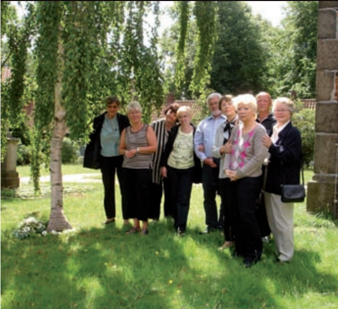
Eltern und Angehörige gedenken in Ahrensburg