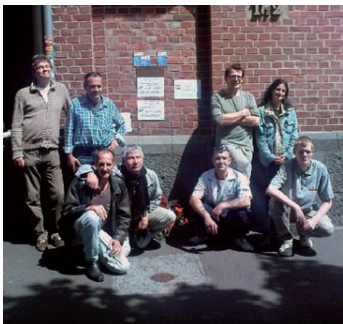
JES Kassel am 21.07. vor der Gedenktafel