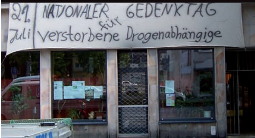
Die Krisenhilfe vorher am 20. Juli ...