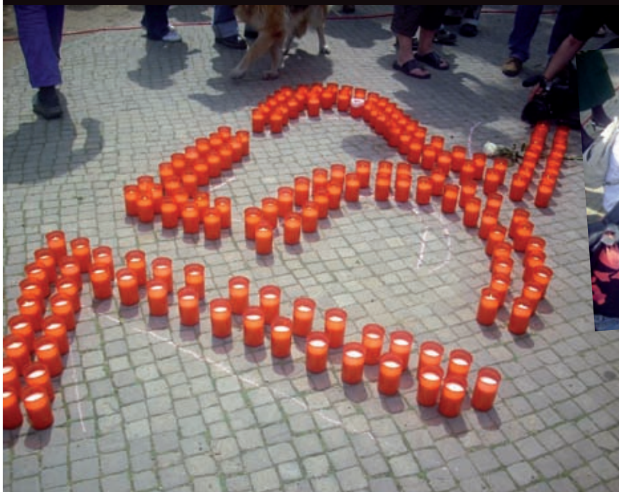
Ein beeindruckendes Symbol