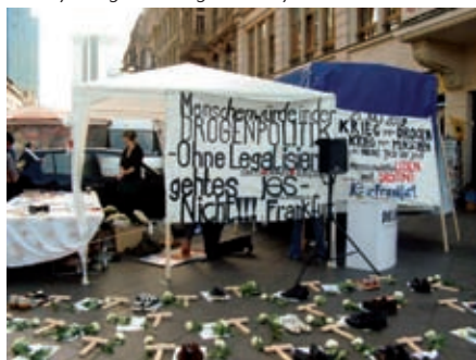
Gedenken und Protest