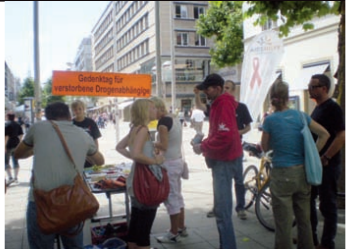
Gedenktag in Stuttgart