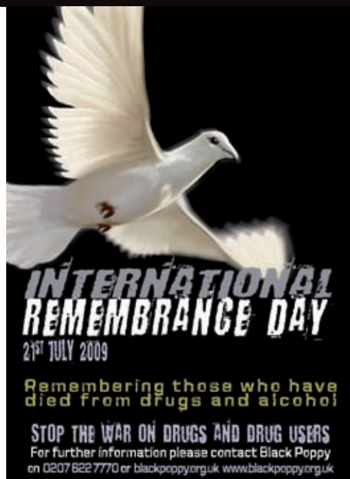
Plakat zum Gedenktag in Birmingham

Amsterdam ■ Leider lagen uns bis zum Redaktionsschluss noch keine näheren Informationen zum Gedenktag in Amsterdam vor. Trotz der geringen Überset-