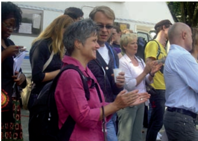
Viele Gäste auf dem Oranienplatz

Die Sonne scheint auf den Oranienplatz, rings um die Wiesen wehen blaue, weiße und orangefarbene Luftballons im Wind, zig rote Kerzen sind zur Zahl 152 aufgestellt. Es riecht nach Bratwürsten, Autos rauschen vorüber, Fahrräder knirschen über den Kies. Neben zwei Mikrofonständern stimmt einer seine Gitarre, Frauen und Männer stehen in Grüppchen und unterhalten sich leise. Doch der Eindruck, hier würde ein Jahrestag oder ein Kiezfest gefeiert, stellt sich gar nicht erst ein.