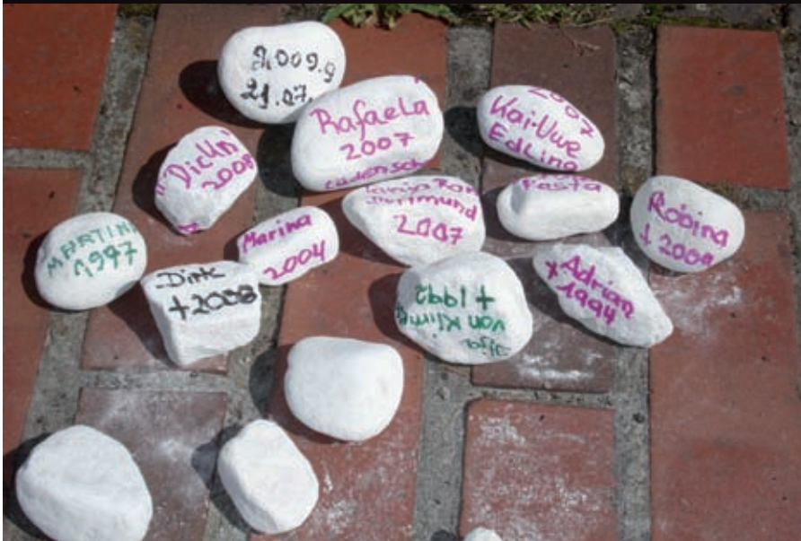
Gedenksteine einmal anders