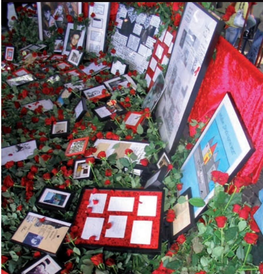
Ein Meer aus roten Rosen für verstorbene DrogengebraucherInnen