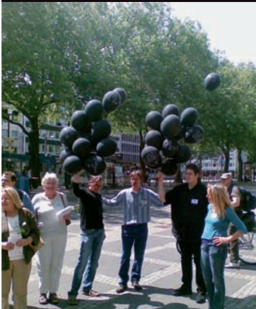
Schwarze Ballons als Zeichen der Trauer