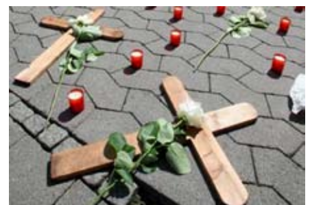
Vor dem Cafe Connection wurde der Toten gedacht