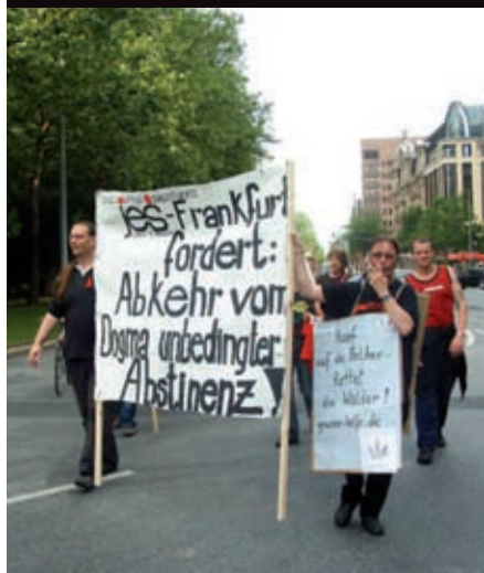
Demo für Legalisierung in Frankfurt