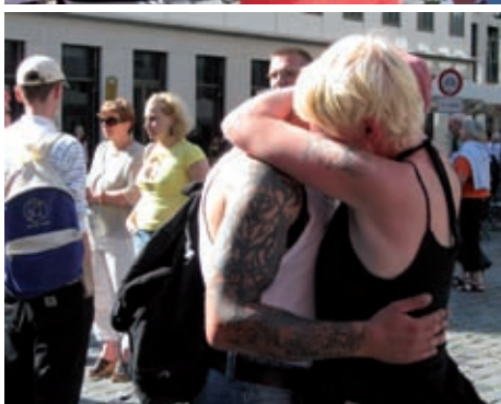
Gedenken in Leipzig | Ballons gegen das Vergessen | Ein stiller Abschied | Ohne Worte