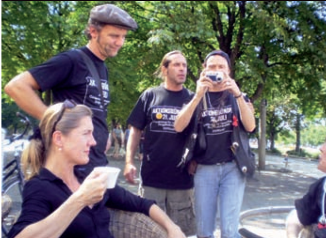
Mitglieder des Stuttgarter Aktionsbündnisses 21. Juli