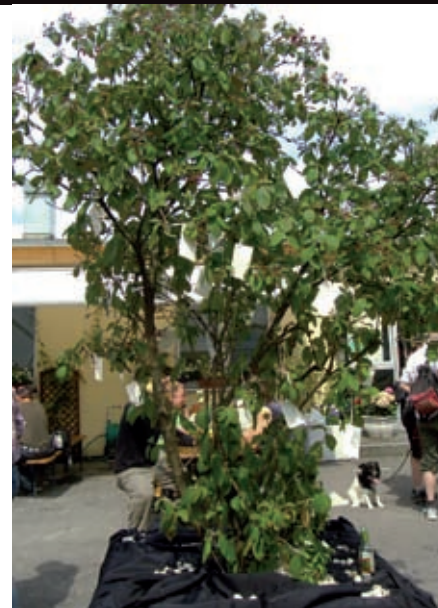
Lebensbaum in Bielefeld