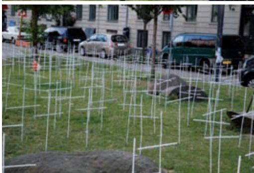
Großes Interesse am Gedenktag in Kopenhagen