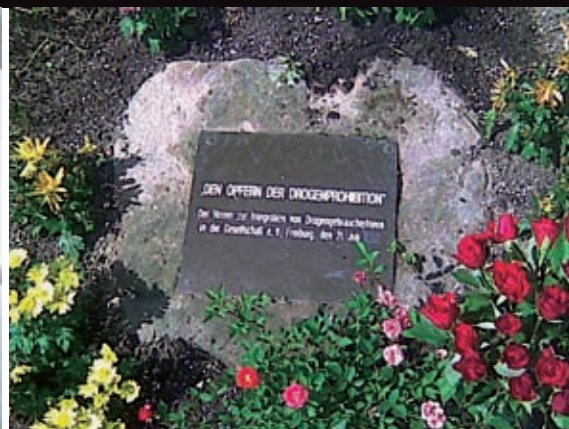
Gedenken an der Dreisam