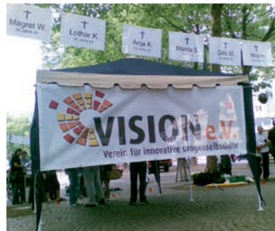
Der Stand von Vision e. V. auf dem Neumarkt