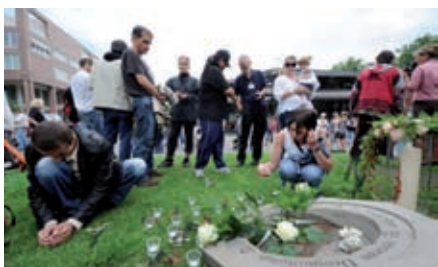
Am Gedenkstein in Dortmund