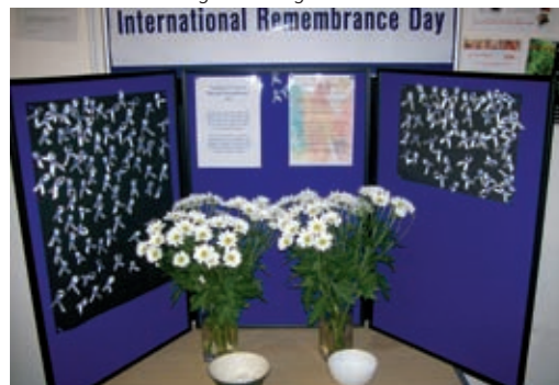
Der erste Gedenktag am 21.07. in Margate (Kent)

zungskünste der Redaktion glauben wir, dass in Amsterdam ein Gottesdienst für verstorbene Drogengebraucher veranstaltet wurde. Organisiert wurde der Gedenktag von einer der ältesten Drogenselbsthilfegruppen der „Belangenvereniging voor Druggebruikers“.