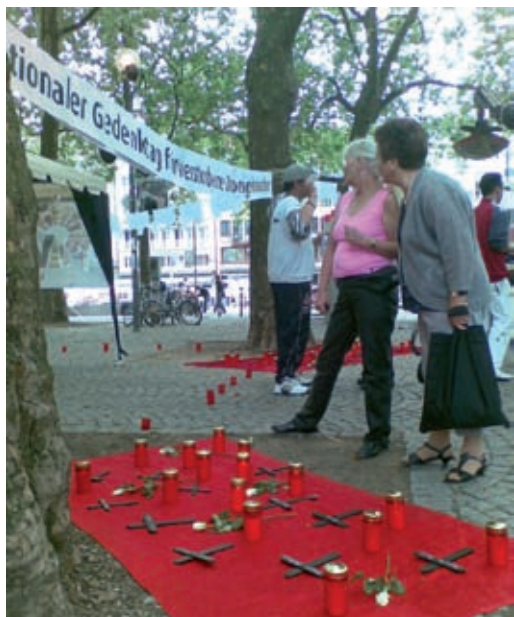
Gedenken auf dem Neumarkt in Köln