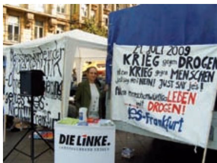
Just say „JES“