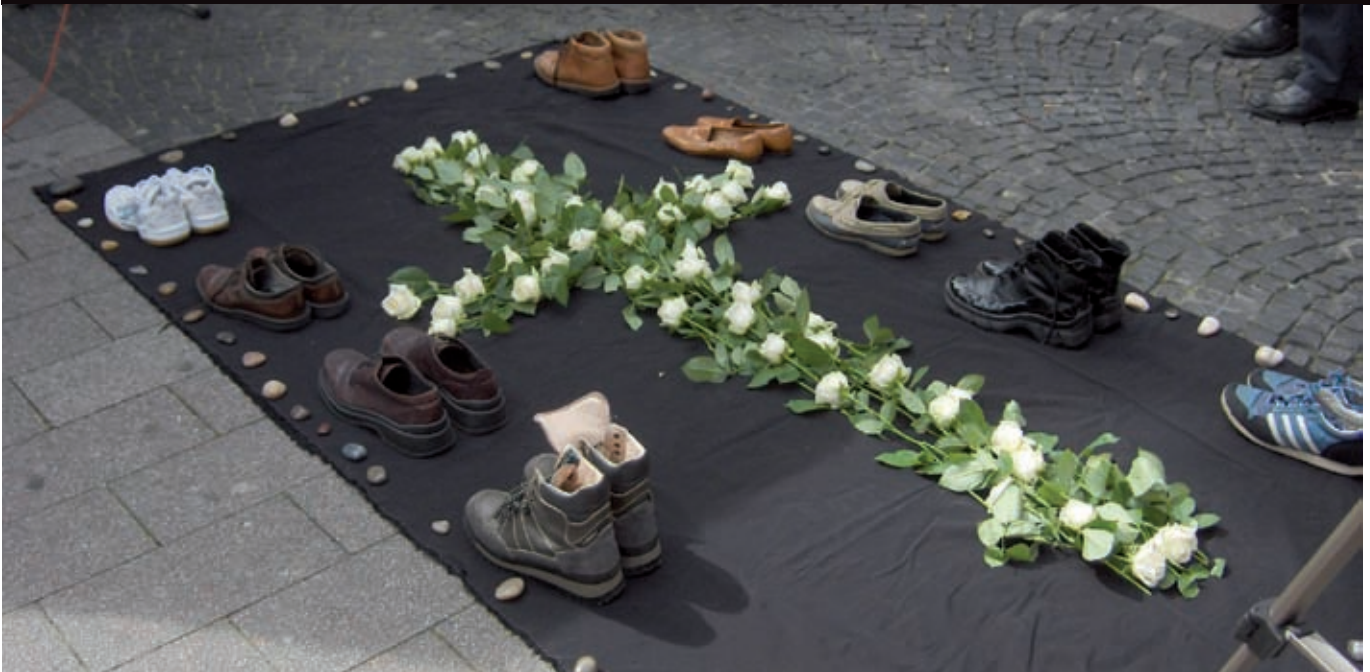
Bilder sagen mehr als 1000 Worte