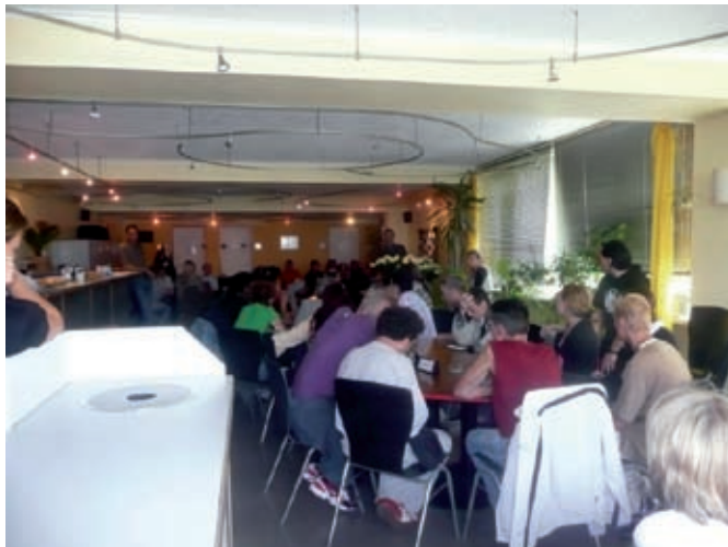
Die Veranstaltung in Essen war gut besucht