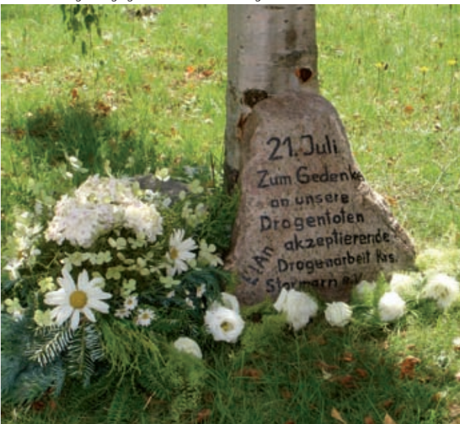
Der Gedenkstein in Ahrensburg