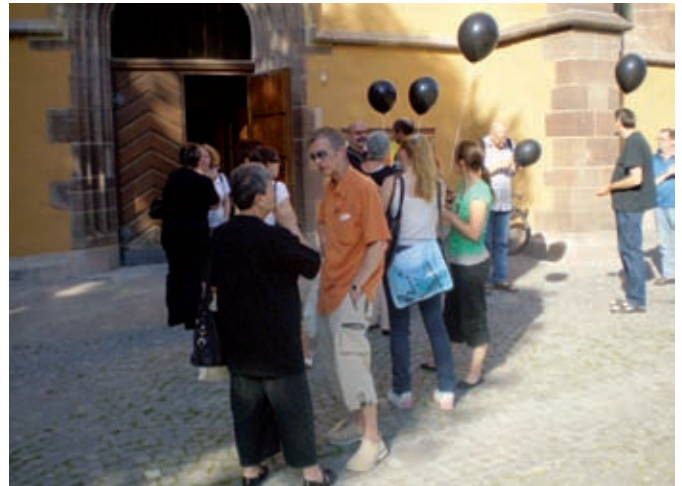
Schwarze Ballons gegen das Vergessen