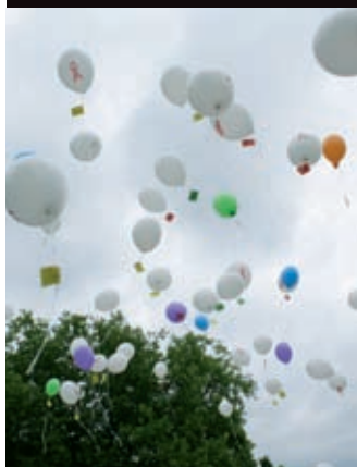
Ballons gegen das Vergessen