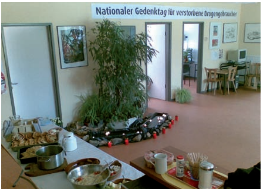
Die Räume von Vision e. V.