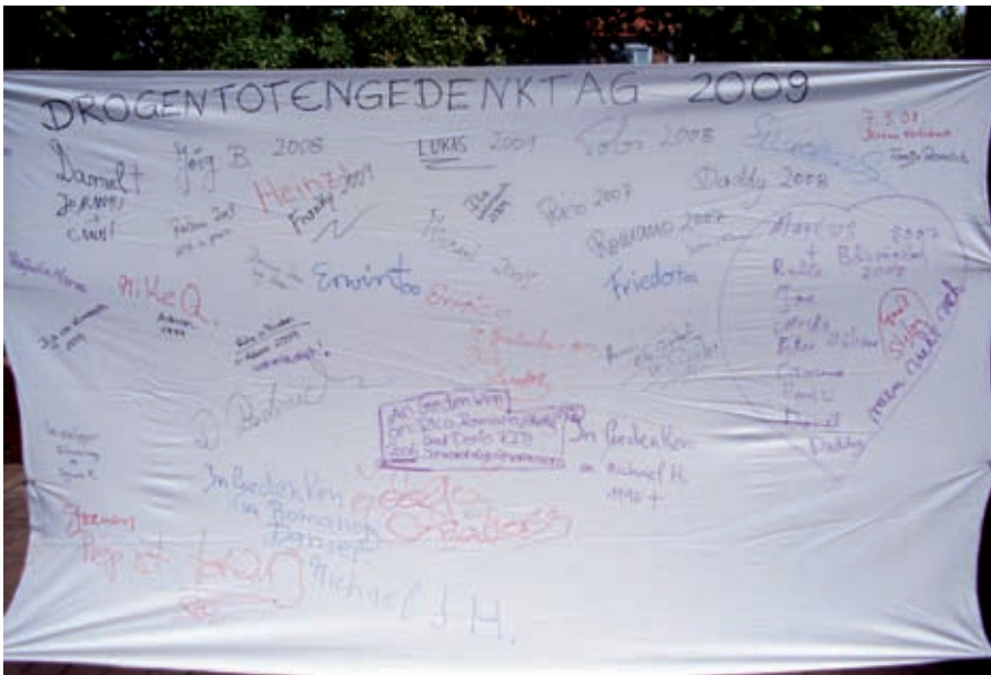
Gedenken in Münster