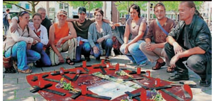
Gedenken für Drogentote in Oldenburg