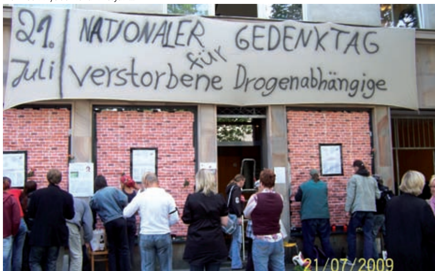
... und einen Tag später: viele DrogengebraucherInnen beteiligten sich an der Aktion