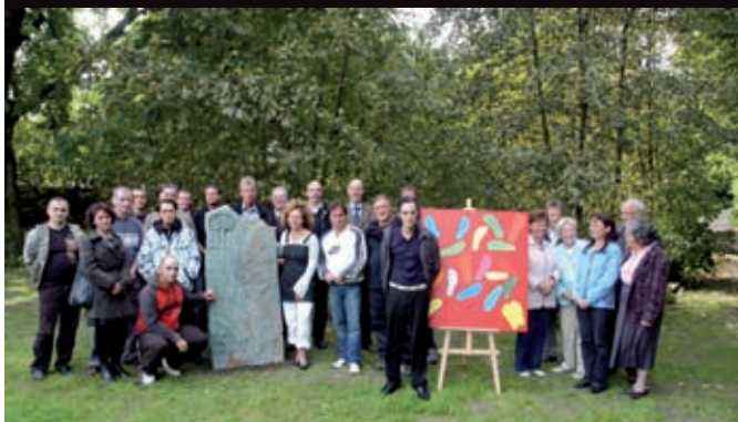
Am Westerdeich wurde erstmals am neuen Gedenkstein gedacht