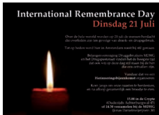
Einladung zum Gedenktag in Amsterdam