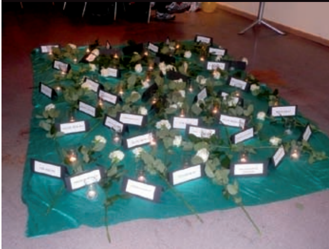
Der 21. Juli in der Suchthilfe direkt Essen