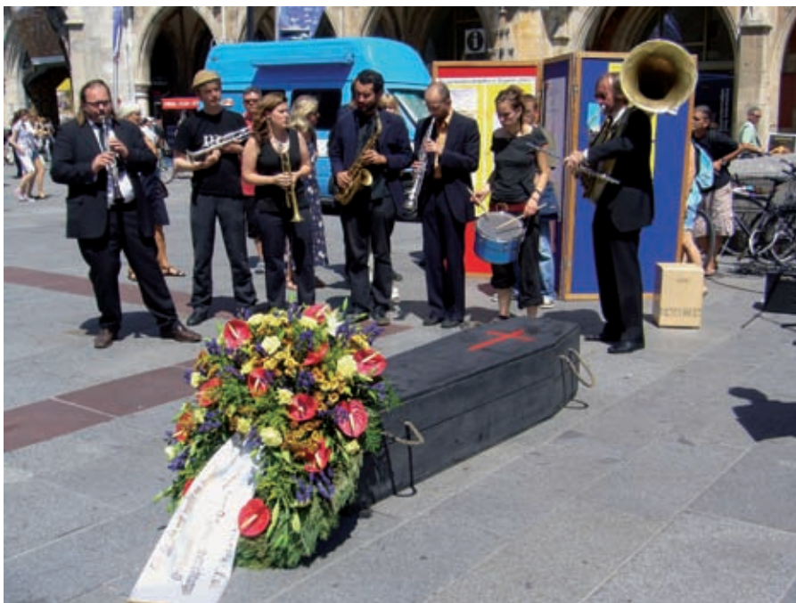
Gedenken und Musik in München