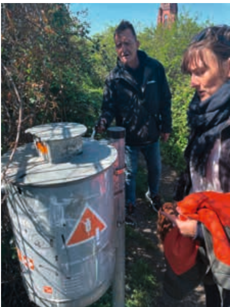
Der Spritzenabwurfbehälter im Görlitz