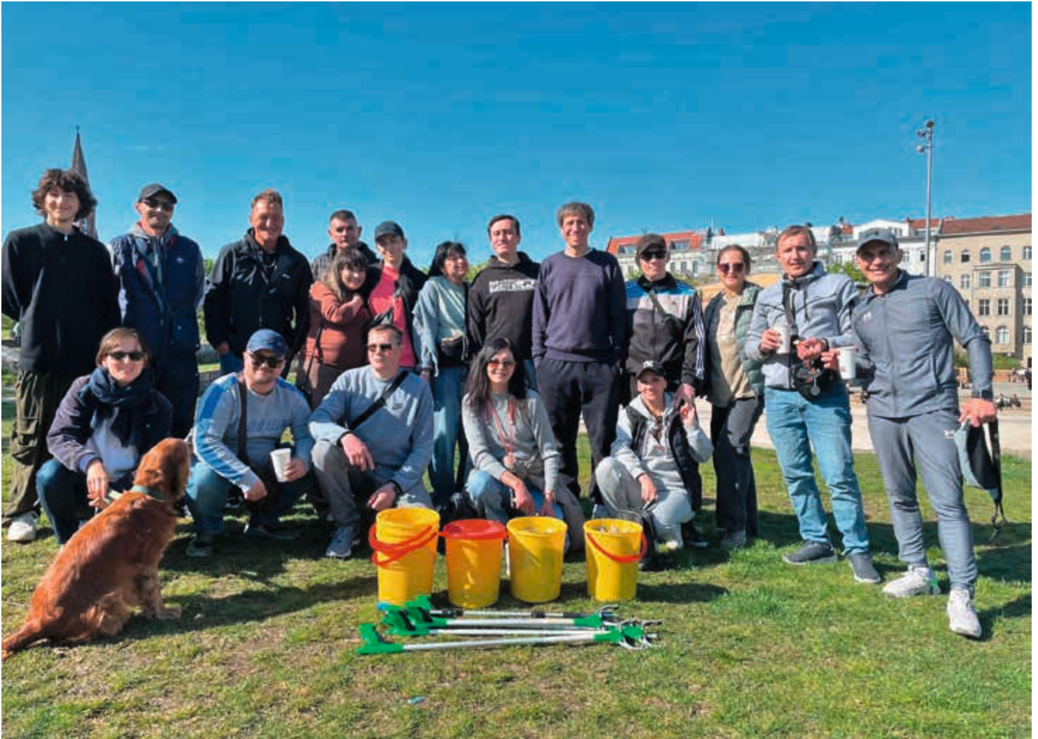
Es ist geschafft, der Park ist ein wenig sauberer

Woche später saß sie beim Meeting der Selbsthilfegruppe und sprach über ihre Schwierigkeiten in Berlin. Dank BerLun hat sie erfahren, wie sie ihre Substitutionstherapie fortsetzen kann und was sie dafür braucht. Auch eine Wohnung hat sie mit Hilfe BerLuns bekommen, wo sie jetzt mit ihrem Sohn wohnt.