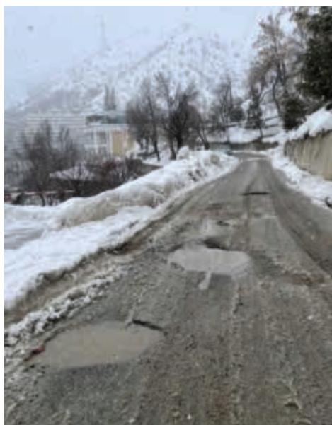
Der Weg zum Tagungsort war ein Abenteuer

Die Frauen sind aus verschiedenen Regionen des Landes angereist. Viele von ihnen haben lange und gefährliche Wege hinter sich. Mobilität ist hier keine Selbstverständlichkeit, sondern oft eine Frage von Ressourcen und Infrastruktur.