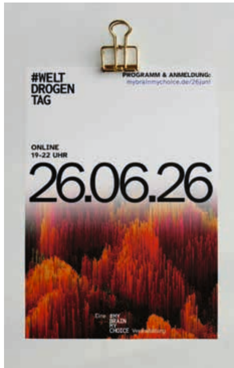
Programm, Anmeldung und Fragen: https://mybrainmychoice.de/26juni

Der Weltdrogentag wurde im Jahr 1987 von der UN als „International Day against Drug Abuse and Illicit Trafficking“ ausgerufen und bis heute werden an die-