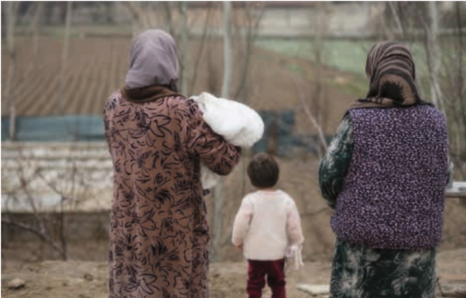
Das Maß an Stigma dem Frauen ausgesetzt sind ist hoch.

Jetzt sind wir an einem Ort, den die Frauen gemeinsam zu einem sicheren Raum machen. Viele kennen sich nicht. Einige sind zum ersten Mal überhaupt bei einem Treffen zu HIV. Und doch beginnt schon die erste Vorstellungsrunde anders als geplant. Was als kurzes Kennenlernen gedacht war, wird zu einem Raum für Erfahrungen, die im Alltag oft unsichtbar bleiben. Die Frauen sprechen über Gewalt, über ökonomische Abhängigkeiten, über ihr Leben mit HIV. Einige berichten, dass sie erst während der Schwangerschaft von ihrer HIV-Infektion erfahren haben. Andere benennen Ausgrenzung – in der Familie, im Dorf, im Gesundheitssystem: über die strukturellen Ungleichheiten, die ihre Lebensrealitäten prägen. Es fließen Tränen. Die Frauen stärken sich, stellen keine Fragen. Für viele ist es das erste Mal, dass sie ihre Erfahrungen in einem geschützten Rahmen aussprechen können – und dass diese Erfahrungen nicht relativiert oder infrage gestellt werden.