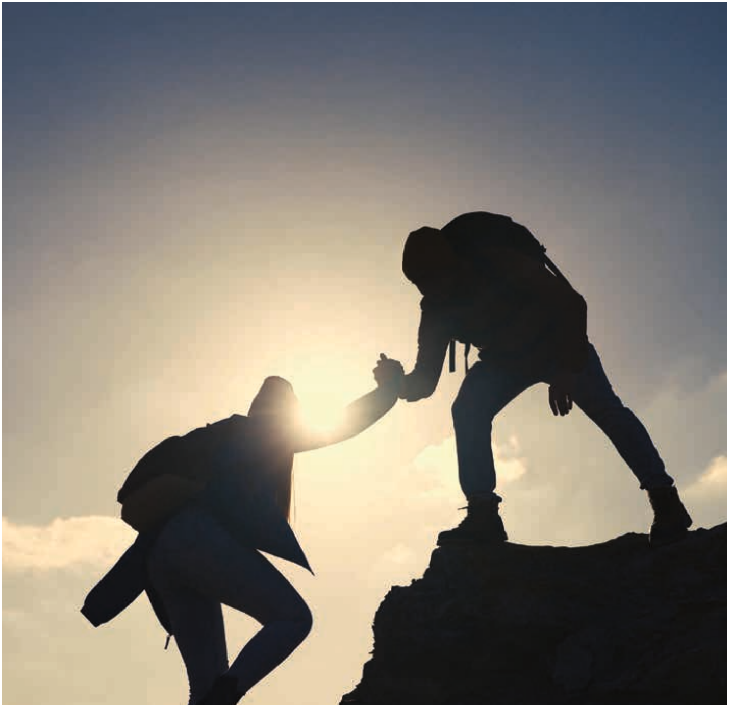
Foto ausschließlich zu illustrativen Zwecken verwendet, mit Model gestellt.