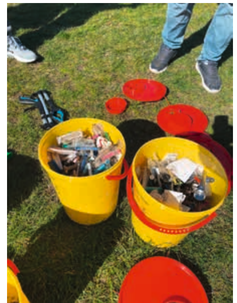
18 Liter Konsumabfälle nach einer Stunde

Es ist ein sonniger Samstag in Berlin und ein toller Tag, um etwas zusammen zu unternehmen. Das dachten sich auch die Menschen von BerLun – eine Berliner Gruppe von russischsprachigen Drogen konsumierenden Menschen. Sie haben sich im berühmten Görlitzer Park versammelt, um Spritzen und andere Konsumutensilien zu sammeln.