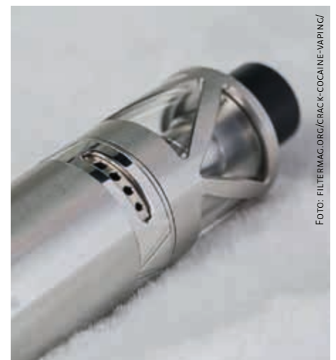
Modell eines Vaporisators